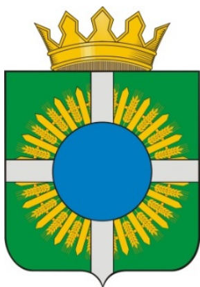
Герб Рис. 2